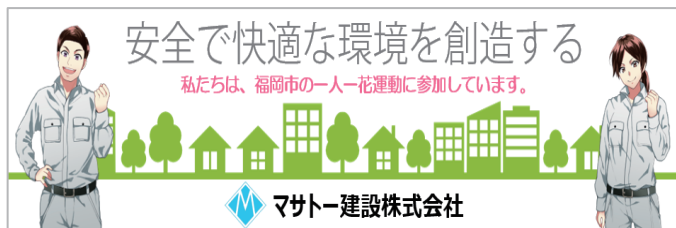
MO-8 W1000×H8000 mm