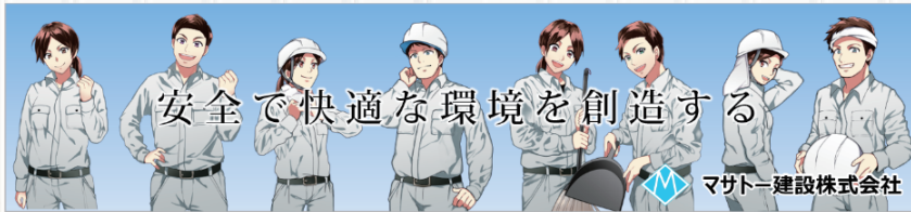
MO-1 W1800×H8000 mm

あらゆる企業は、利益を向上させるために、PR活動によって自社を広く認知してもらい企業価値を高めることを重要視しています。工事現場は建設業にとって自分たちの仕事を社会に見せる格好の場所であり、PR活動に最適な場所といえます。企業の理念や技術力やスローガンなどのPR活動によって、地域住民などの第三者の工事への理解が深まり、工事の円滑な進行につながります。また、社会インフラを支える建設業の魅力をアピールすることで、人材の確保や業界全体のイメージアップなど将来の発展につながります。