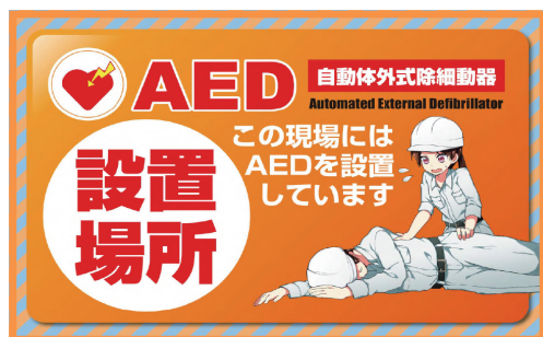
AED 設置 MO-13