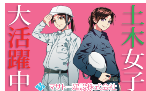
女性（土木女子）の活躍 MO-18

メッセージ（スローガン・キャッチコピーなど）、カラー、サイズはカスタマイズできます。オリジナルデザインの制作もできます。