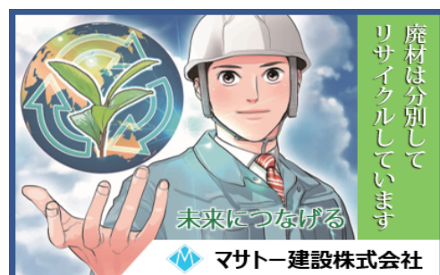
環境にやさしい現場（リサイクル） MO-12