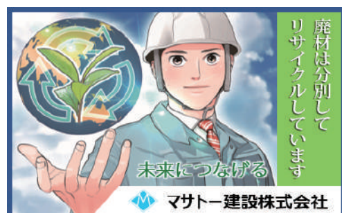
環境にやさしい現場 (リサイクル) MO-12