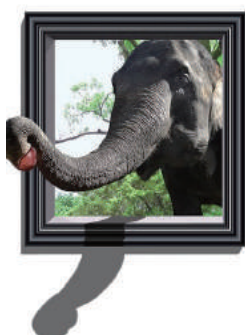
角形額縁タイプ W1210×H1550 mm

フォトリックアートは、遊び心にあふれた疑似立体イラスト装飾。動物を題材としたトリックアートで、まるで本物の動物が飛び出して来たようなリアリティを感じさせ、通りがかる人々に対して驚きと感動を提供します。工事現場から人々に笑顔を届けることは素晴らしい地域貢献ではないでしょうか。インスタ映えする話題のスポットになるかもしれません。