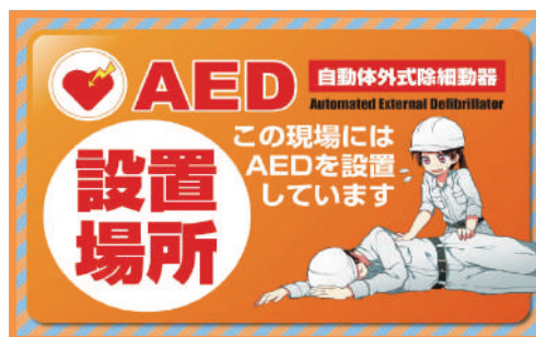
AED 設置 MO-13