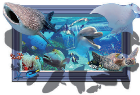
特殊角形額縁タイプ B W3200×H1800 mm

各種タイプ（サイズ）ごとに様々な種類のデザイン（動物など）があります。詳しくはお問い合わせください。