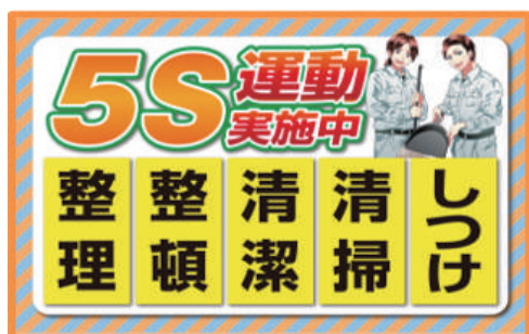
5 S 運動 MO-11