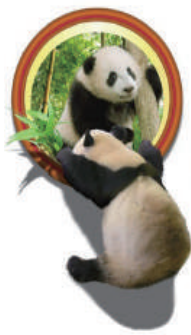
円形額縁タイプ W910×H1550 mm