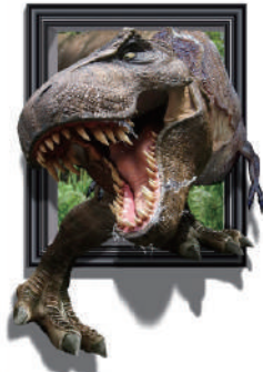
特殊角形額縁タイプ A W3200×H1800 mm