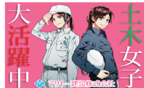
女性 (土木女子) の活躍 MO-18

メッセージ (スローガン・キャッチコピーなど)、カラー、サイズはカスタマイズできます。オリジナルデザインの制作もできます。